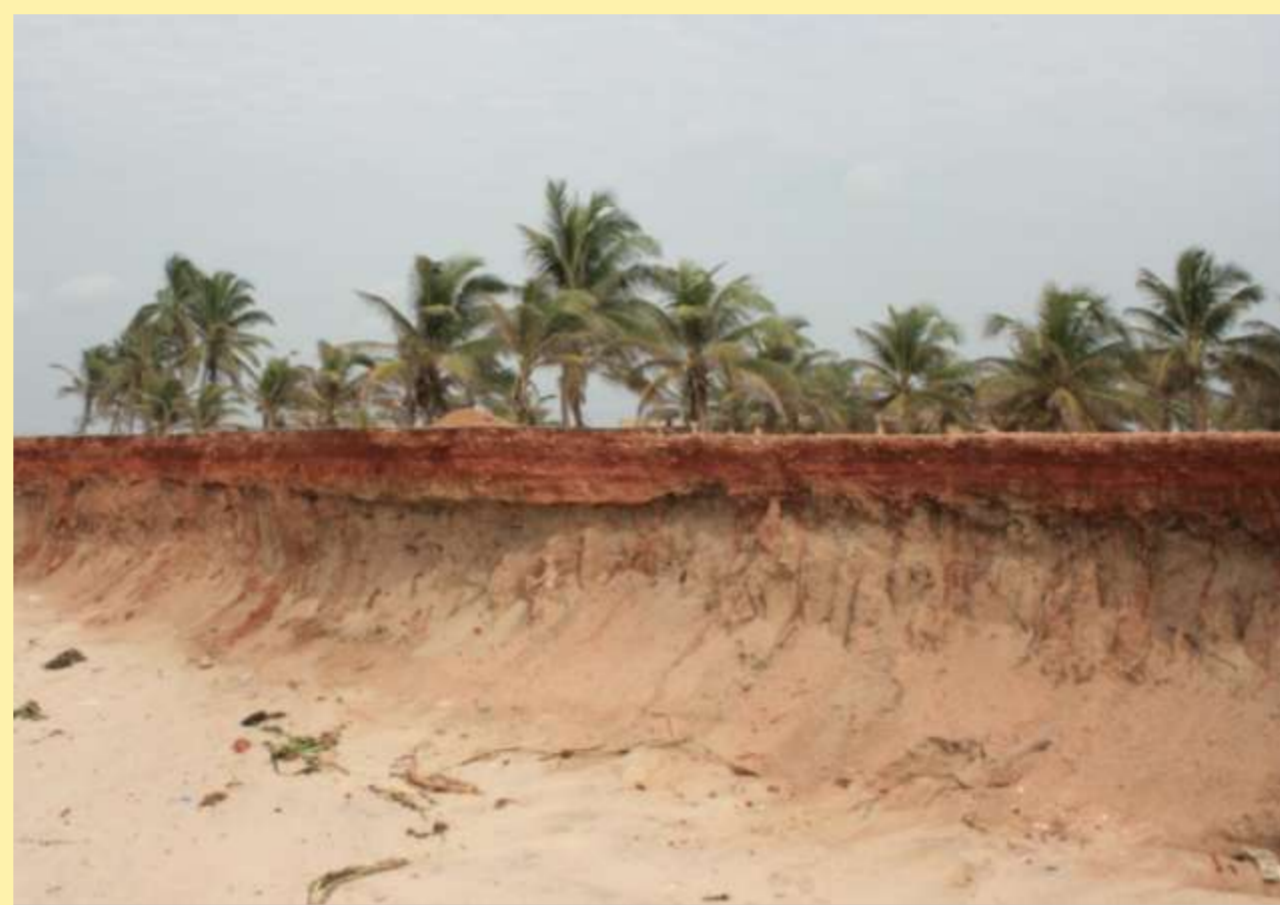
Die Atlantikküste bei Ada zeigt deutliche Spuren mariner Erosionsprozesse.