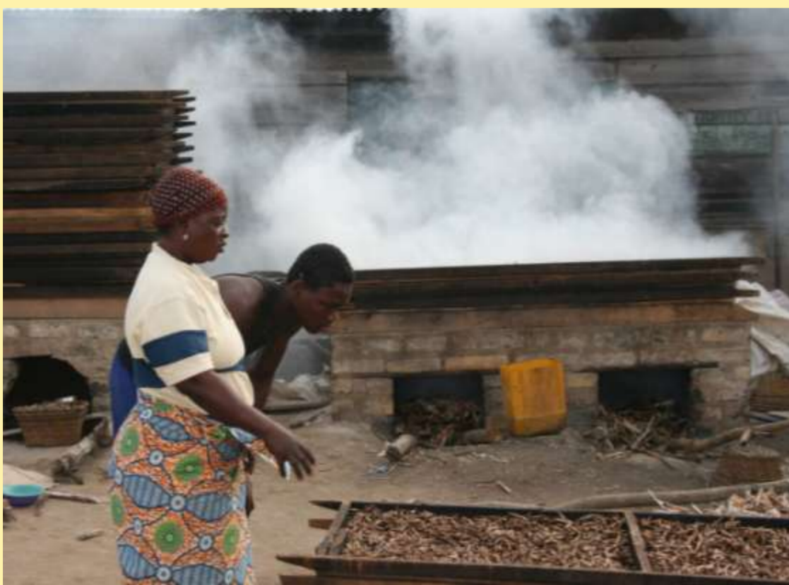
Tema New Town ist einer der wichtigsten Verarbeitungsorte von Abobi Räucherfisch.