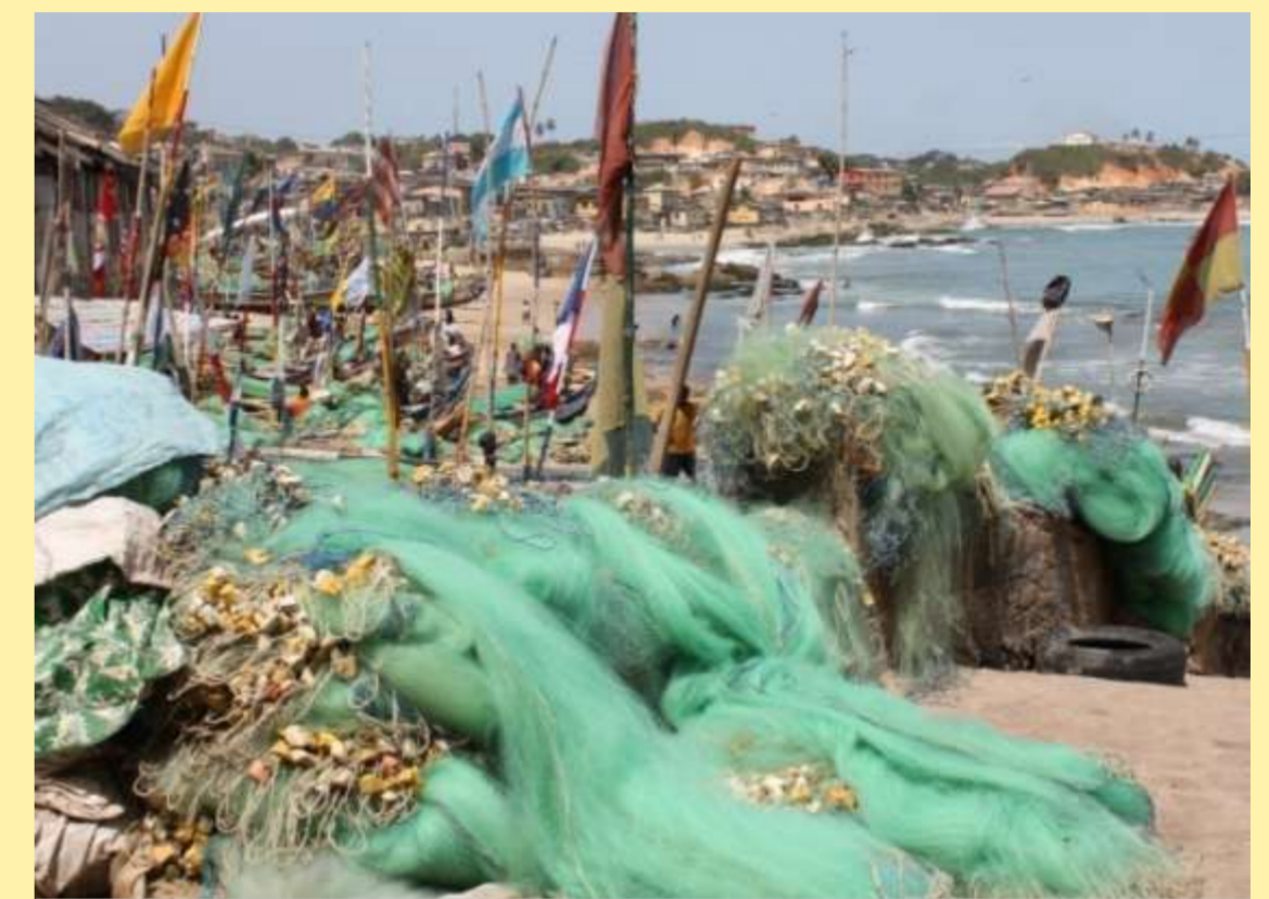
Elmina, die ehemalige Sklavenburg, ist heute von Fischerei und Tourismus geprägt.