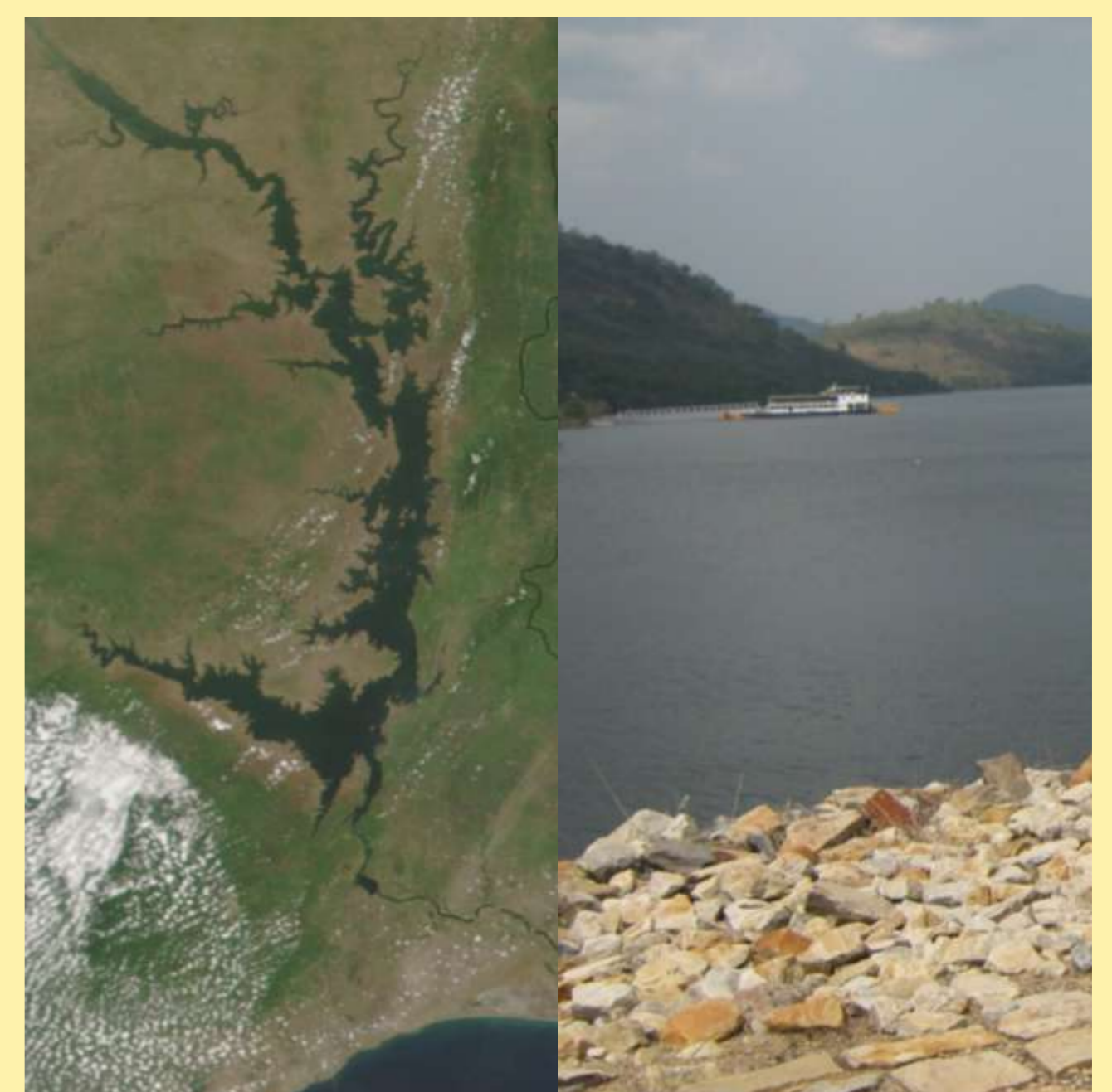
Der Voltastausee, 1966 fertig gestellt, ist das oberflächengrößte künstlich angelegte Gewässer Afrikas und Ghanas wichtigste Energiequelle.