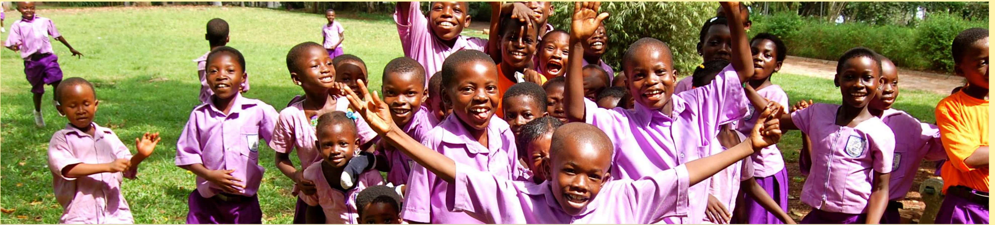
Schülerinnen und Schüler der sechsjährigen Primary School, in ihrer obligatorischen Schuluniform. Die Schule in Ghana vermittelt Grundzüge des Lesens und Schreibens sowie der Mathematik. In allen Schulformen wird großer Wert auf Disziplin, Sauberkeit und kurz rasiertes Haar bei Jungen wie Mädchen gelegt.