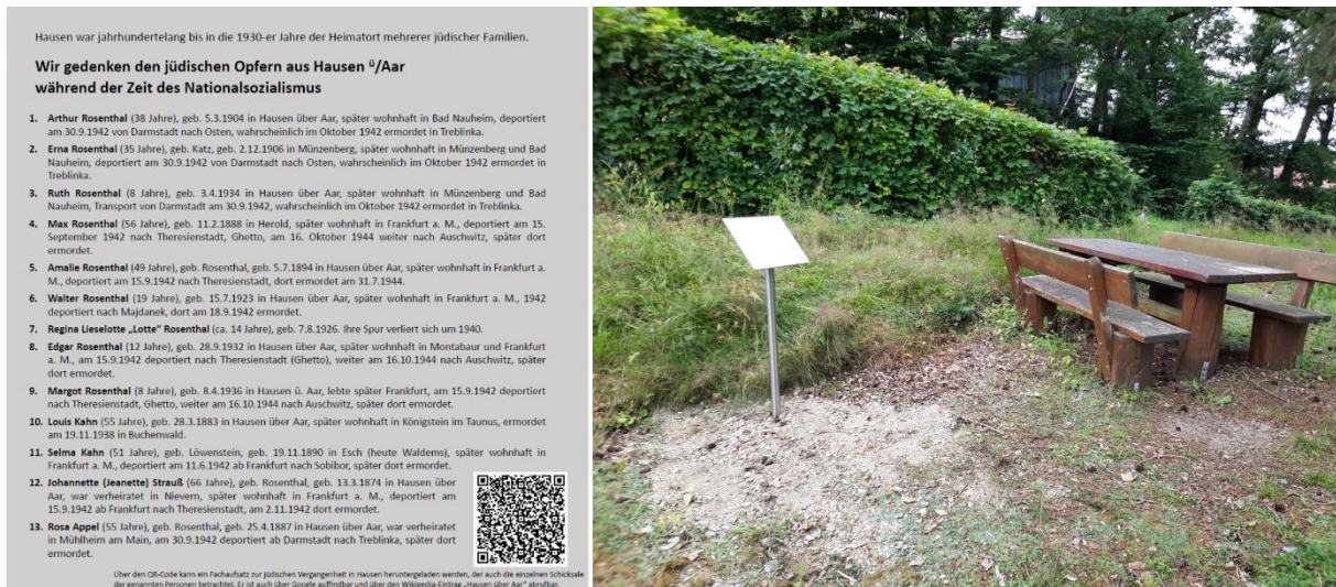
Abb. 6: Gedenktafel am Friedhof in Hausen über Aar, aufgestellt am 6.7.2024.