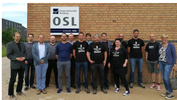
Innsbrucker und Flensburger im Juni vor dem Gebäude „OSLO“

stehen im Berufsbildungsbereich vor ähnlichen Problemen. Exemplarisch seien hier die sinkenden Ausbildungszahlen und steigenden Matura- bzw. Abiturquoten genannt. Nach dem Vortrag entwickelte sich eine lebhaft Diskussionsrunde, die bei einem gemeinsamen Grillfest fortgesetzt wurde. Die Fachschaft hatte es anlässlich des Besuchs und des nahenden Endes der Vorlesungszeit veranstaltet. Als nächstes ist ein Gegenbesuch von Flensburger Studierenden und Dozierenden in Innsbruck geplant. Es steht zu hoffen, dass sich der Austausch verstetigt und eventuell sogar eine Erweiterung um die neue, nicht am biat verortete berufliche Fachrichtung Ernährungs- und Hauswirtschaftswissenschaft erfährt.