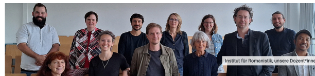
Institut für Romanistik, unsere Dozent*innen

Neben den Lehramtsstudiengängen Französisch bzw. Spanisch bieten wir auch den trinationalen Bachelor-Studiengang „Transkulturelle Europastudien: Sprachen, Kulturen, Interaktionen“ an, der das Studium in Flensburg sowie in Straßburg (Frankreich) und Málaga (Spanien) umfasst.