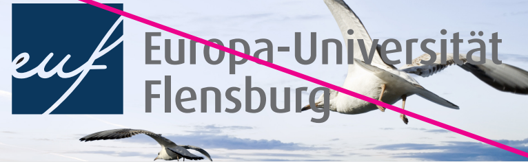
Verwendung auf ungünstigem Bildmotiv ohne weißen Rahmen