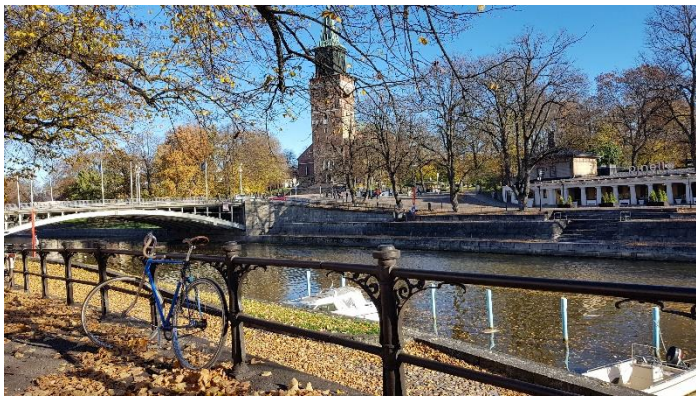
Aura river in Turku