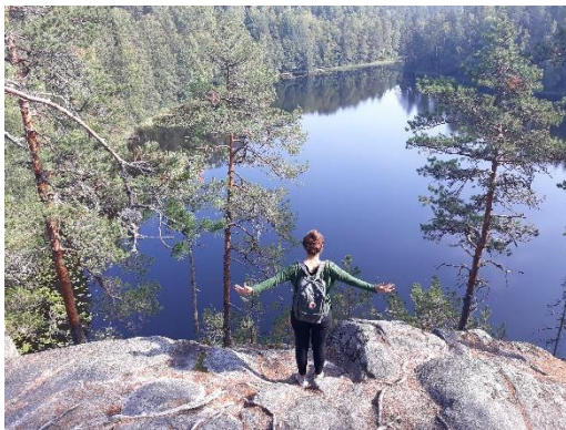
Nuukio Nationalpark in der Nähe von Espoo

FOTOS Hiermit erkläre ich, dass Rechte Dritter an dem/den unten näher bezeichneten Foto/s nicht bestehen und ich der EUF die Nutzung dieses/dieser Fotos gestatte Ja Nein