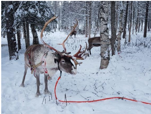
Rentier Farm in Lapland