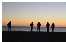
Sonnenaufgang in La Franqui