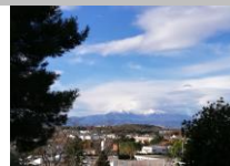
Der Canigou (heilige Berg der Katalanen)