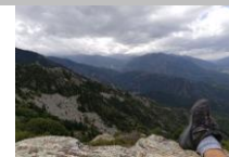
Wandern in den Bergen (Pic du Cogolló)