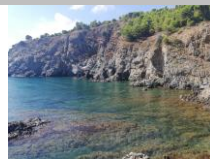
Küstenwanderung Cerbère - Banyuls-sur-Mer