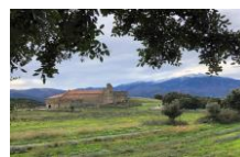
Wandern in den Bergen (Marcevol)