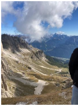
Blick aus dem Rosengarten