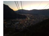
Bozen aus der Gondel