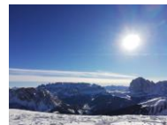
Val Gardena 1