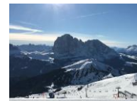
Val Gardena 2