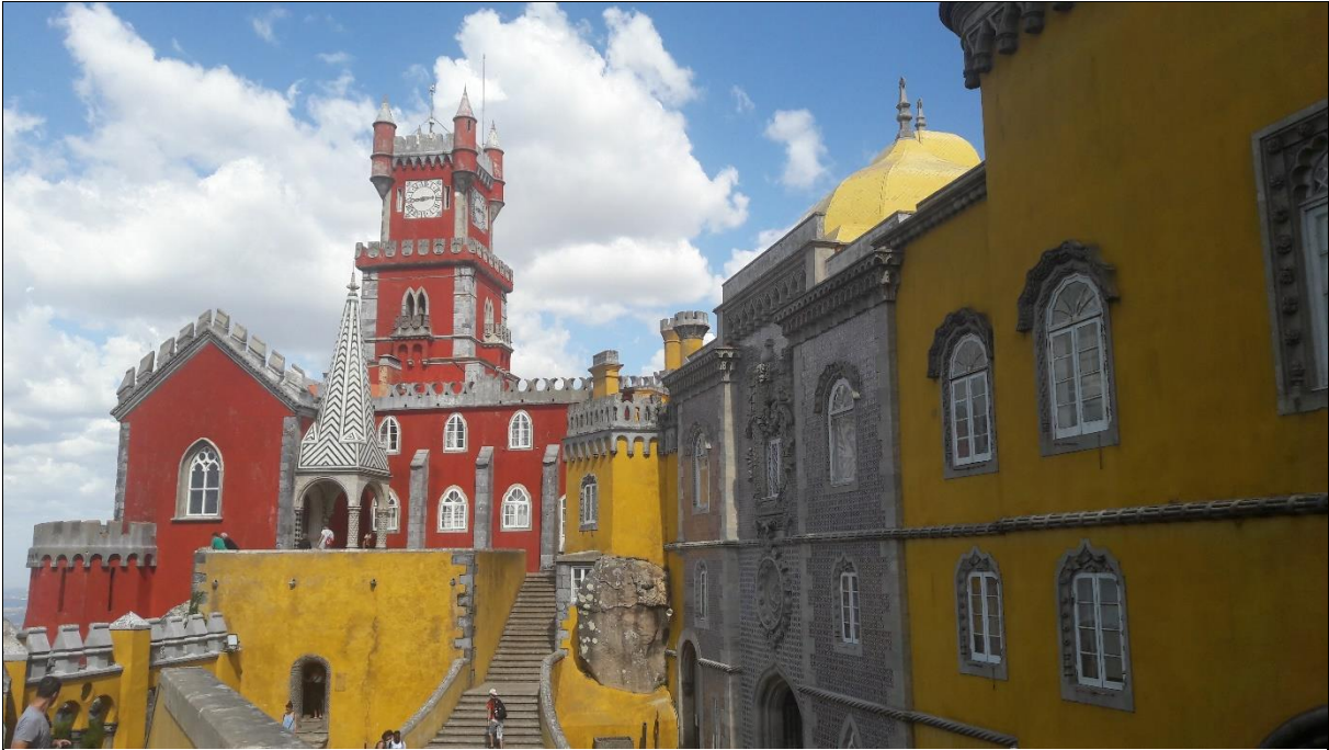
Figure 3 - Sintra (ca. 1 h von Lissabon entfernt) ist auf jeden Fall einen Besuch wert