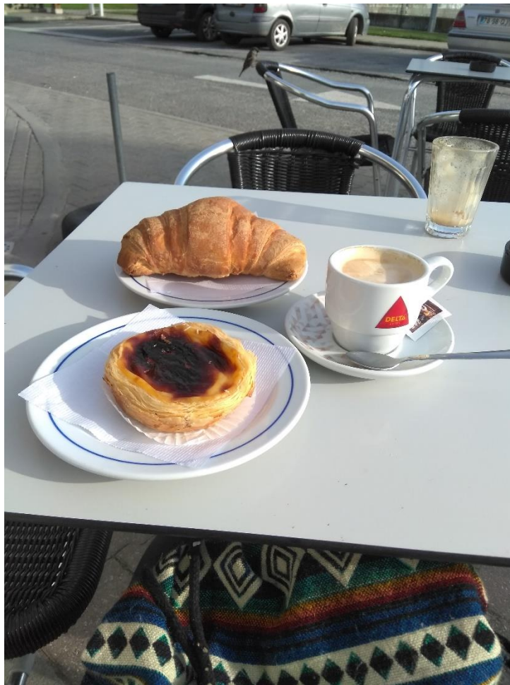
Figure 4 - Pateis de Nata und Kaffee haben mich durch mein Auslandssemester begleitet