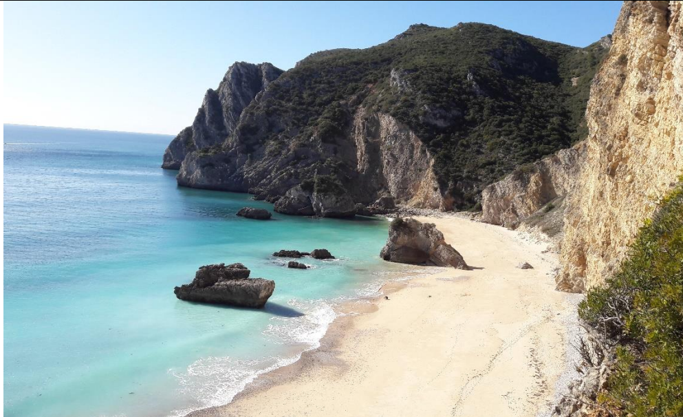
Figure 1 - Mein Lieblingsstrand in unmittelbarer Nähe von Lissabon