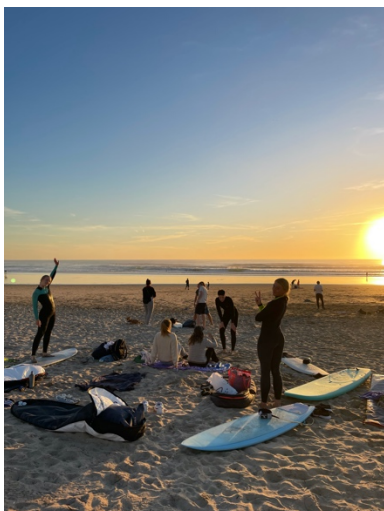
Costa de Caparica