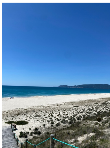
Península de Tróia