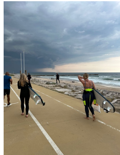
Costa de Caparica