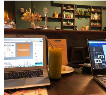
Arbeiten in den kleinen Cafés