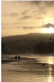
Das Auditorium bei Abend