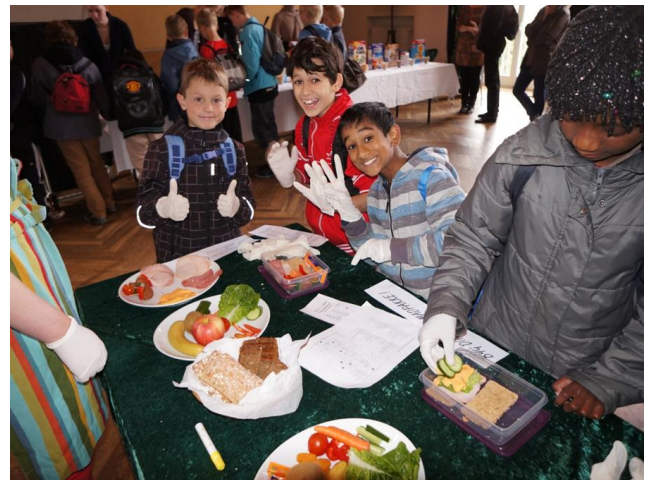
På stationen "lave madpakke" var ansvarlighed og 'sjov med at prøve' påkrævet.

Eleverne pakkede deres ønskemadpakke eller lærte alternativer til de stærkt sukkerholdige drikke at kende gennem lækre Smoothies med pebermynte, ingefær, æble m.m. Alle stationer var interaktive så børnene sammen med studenterne selv kunne afprøve og erfare en masse.